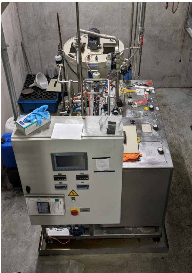
Gesamtbild der Anlage