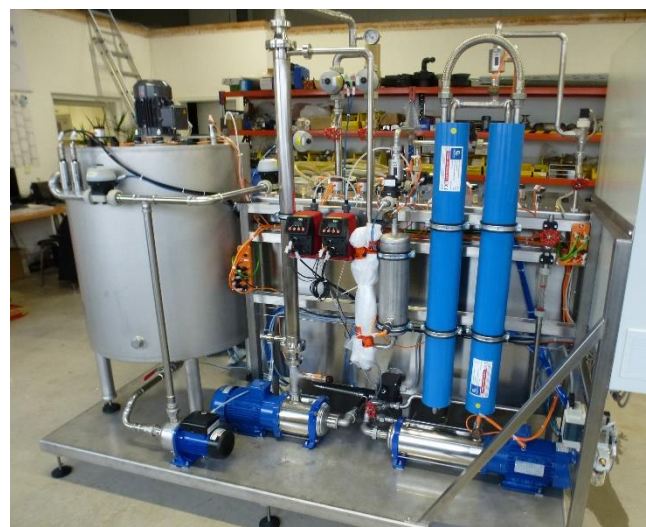
Anlage im internen Testlauf