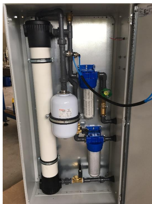
Anblick der Anlage