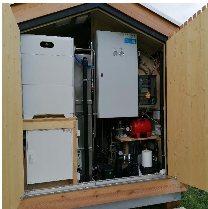
Wandmontage im Technikraum