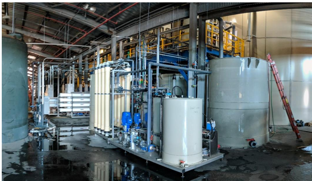
Gesamtbild der Anlage