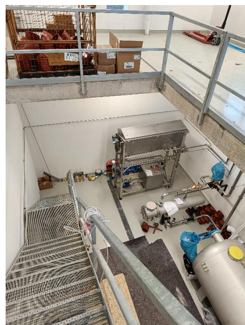
Aufstellung bei dem Kunde