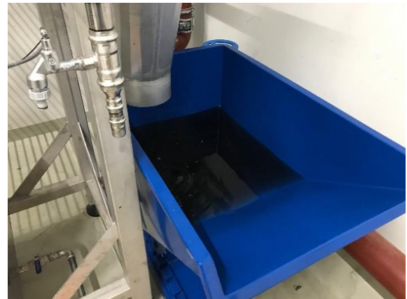
Auffangbehälter von Flusen und Fasern