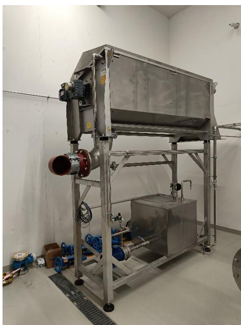
Gesamtbild der Anlage